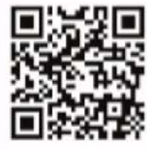
日發票網路購買查詢系統