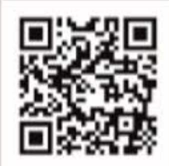
日發票網路購買查詢系統